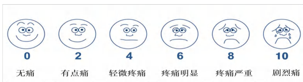
图 D.1 Wong-Baker 面部表情疼痛评价量表

Wong-Baker 面部表情量表法适用于 3 岁及以上儿童，采用 6 种面部表情，用从微笑到哭泣的不同表情来描述疼痛。首先向患儿解释每种表情代表的意义。“0”，非常愉快，没有疼痛；“2”，有一点疼痛；“4”，轻微疼痛；“6”，疼痛较明显；“8”，疼痛较严重；“10”，剧烈疼痛。越靠左的表情疼痛越轻，越靠右的表情疼痛越严重。然后让患儿选择 1 种最能代表目前咽部疼痛感受的表情脸谱。研究使用可通过官方网站 ( https://wongbakerfaces.org/ ) 获取 [35] 。见图 D.1。