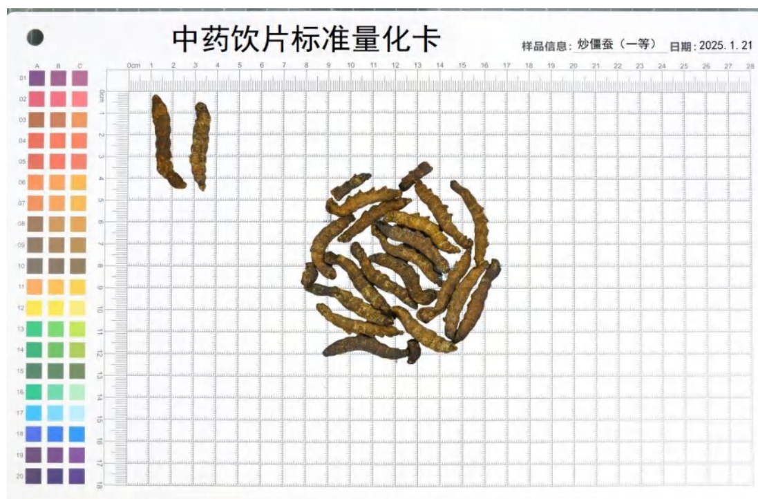
图 1 一等炒僵蚕饮片