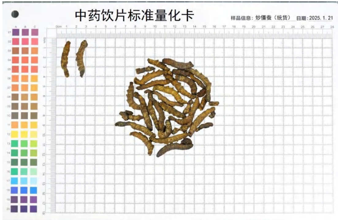
图 3 统货炒僵蚕饮片